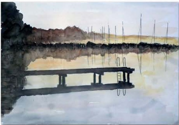
327_Chiemsee Morgenlicht am Chiemsee