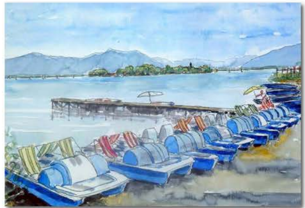
326_Chiemsee Gstadt mit Fraueninsel